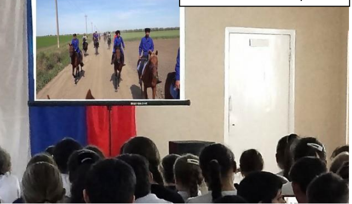
Фильм «Казачий переход»